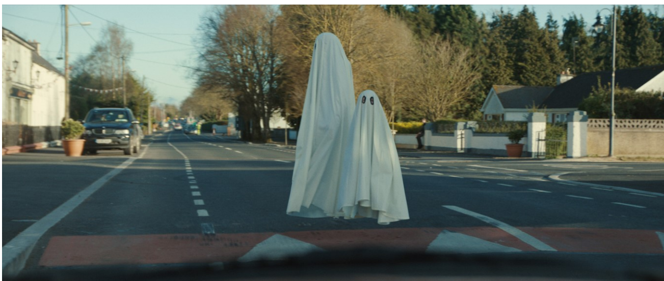
Extra Ordinary – zahajovací film 27. DEF

Slavnostního zahájení se v úterý 16. 6. v Lucerně osobně zúčastní irská velvyslankyně Cliona Manahan. Večerem diváky provede Lukáš Rumlana.